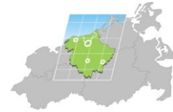
REGIONALER PLANUNGSVERBAND MITTLERES MECKLENBURG/ROSTOCK